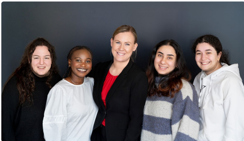
Barne- og familieminister Lene Vågslid