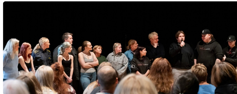
Del 2: Barn og voksne bidro på scenen