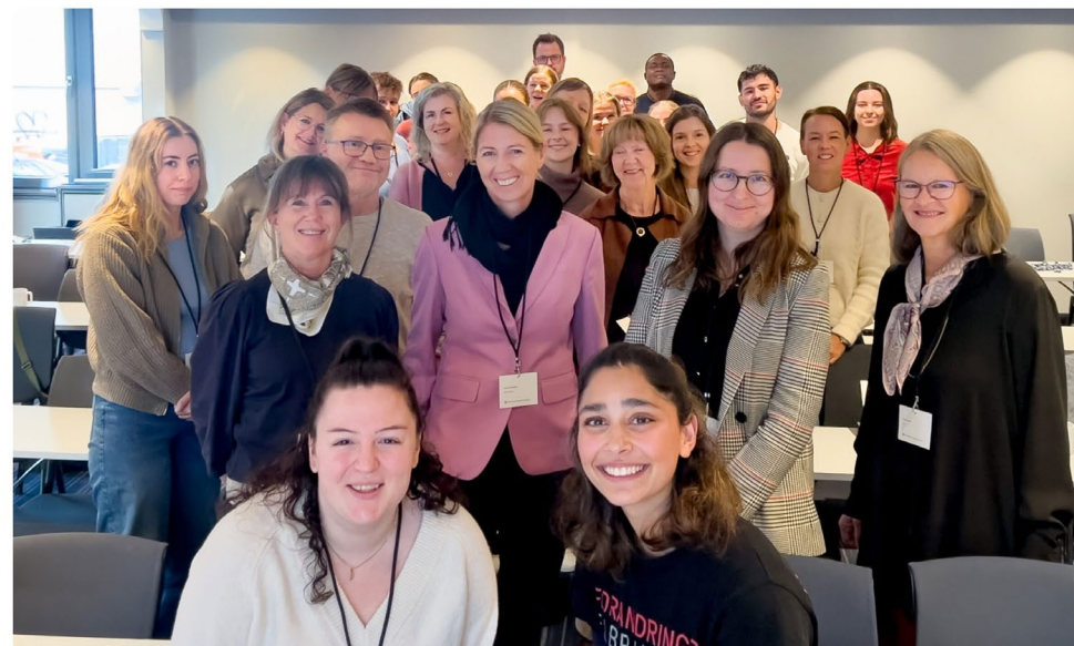
Forandringsfabrikken bidro i konferanse om barns rett til helsehjelp, arrangert av forskergruppa for barnerett ved Universitetet i Tromsø