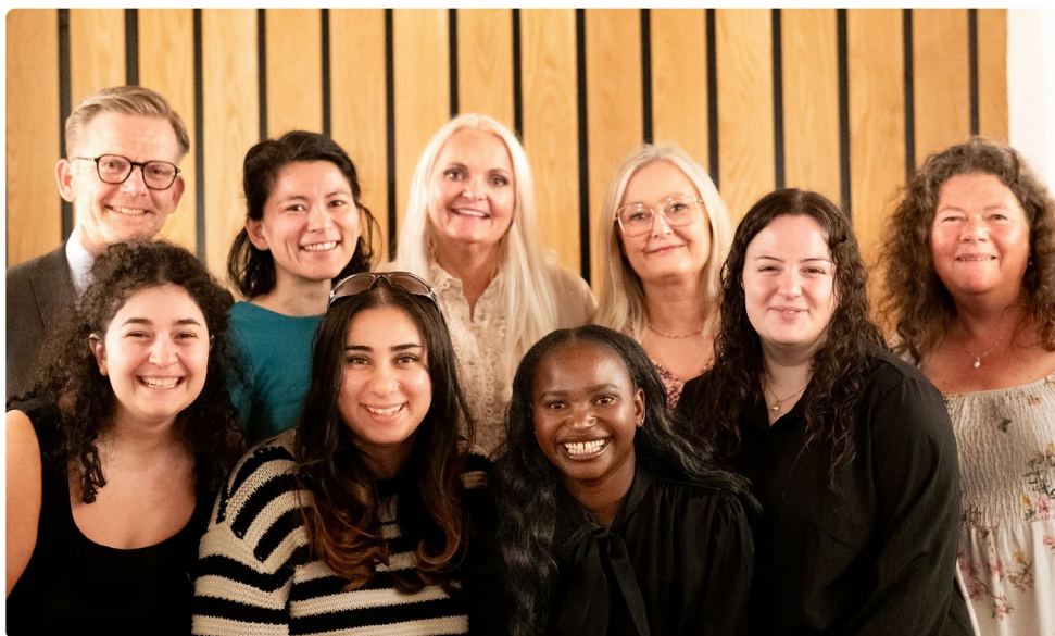
Feiring med familie- og kulturkomiteen på Stortinget etter at det ble vedtatt å gi barn partsrettigheter fra de er 12 år