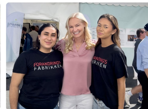
Proffer med Cecilie Østensen Berglund (høyesterettsdommer)