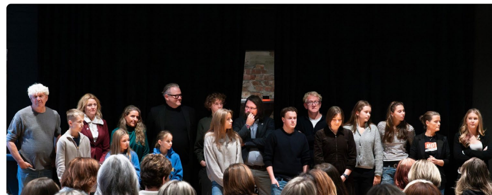
Del 1: Barn og voksne bidro på scenen

Andre del var for ledere og fagfolk i lavterskeltilbud, hjelpetjenester og politi. Målet var å vise hvordan kunnskap fra barn og rettighetene som barn har, henger tett sammen. Vi ville også vise hvordan rettigheter kan sikres i praksis i disse tjenestene – sett fra barn og unge.